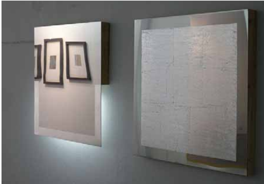
“Complemento V” (Apoyo vertical) 2006 , 50 x 4 x 50 cm, Chapa de acero inoxidable, plata, madera de pino y lámpara luminosa