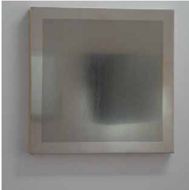
“Complemento I” (Apoyo-sin-vertical) 2006 , 50 x 4 x 50 cm, Chapa de acero inoxidable, madera de pino y barniz