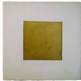
áng. sup. izqdo: “#17# Doble del cuadrado” 2003 , 51 x 51 cm. Oro y grafito s/ papel