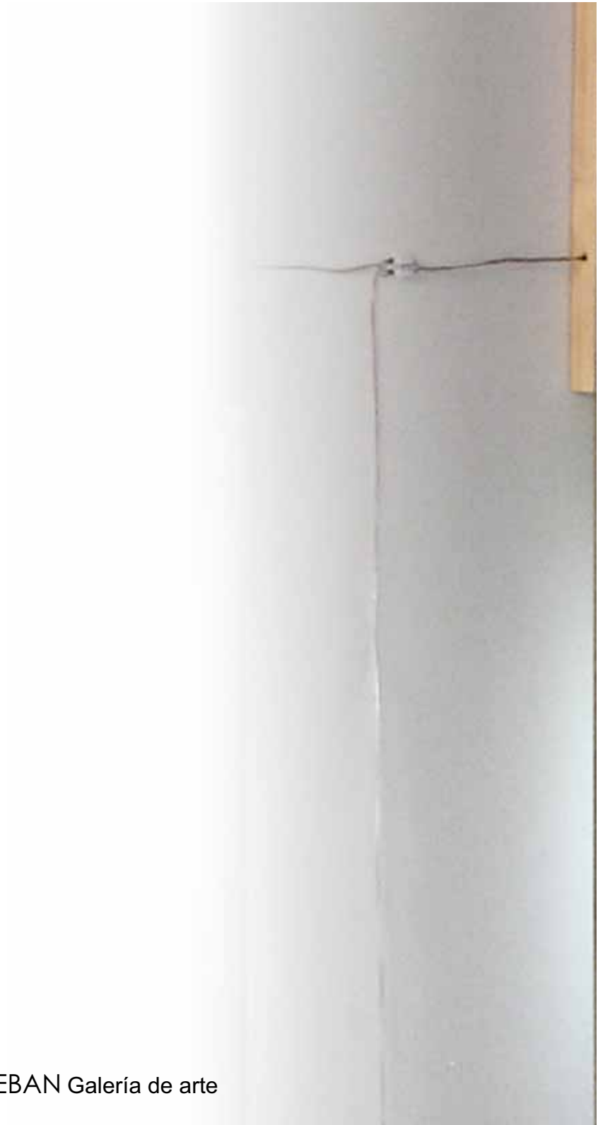
BENITO ESTEBAN Galería de arte